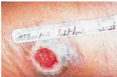
De wond voor Multidex®