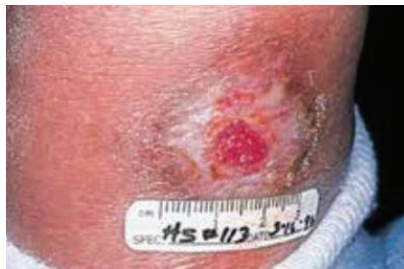
Wond na behandeling